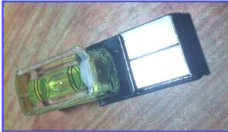
Hình 1. Ảnh chụp thiết bị theo sáng kiến

- Xác định cấu tạo của thiết bị gồm 02 bộ phận: Giá đỡ và bọt nước cân bằng. Khi đó, kích thước thiết bị vào khoảng 2 cm x 6,5 cm và trọng lượng khoảng 110 g.