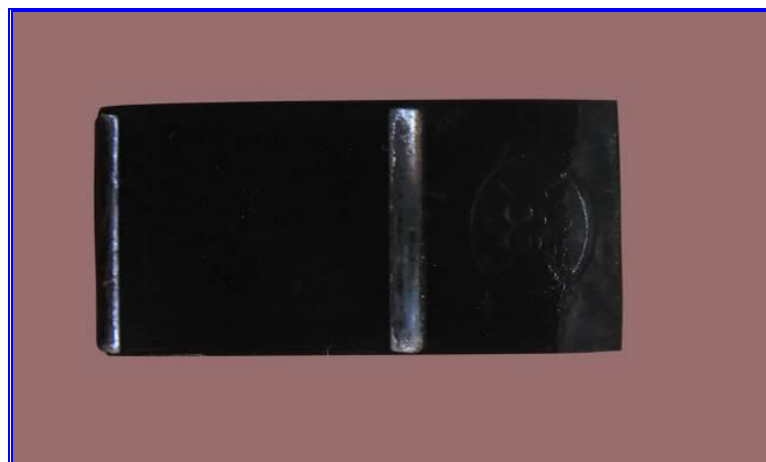
Hình 3. Ảnh chụp thanh kim loại trên giá đỡ thiết bị