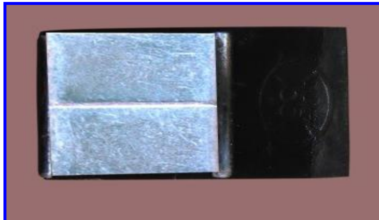
Hình 2. Ảnh chụp giá đỡ thiết bị

+ Giá đỡ gồm 2 bộ phận: Thanh kim loại và miếng nam châm (mua ở cửa hàng điện máy).