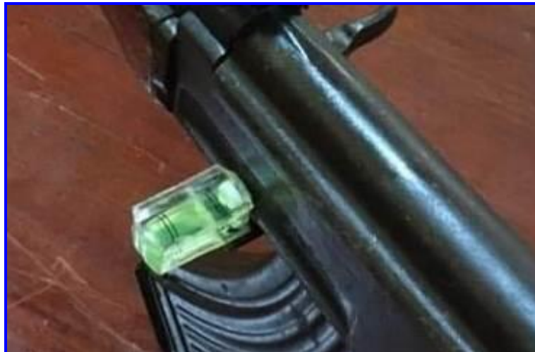
Hình 8. Ảnh chụp thiết bị được lắp đặt trên súng tiểu liên AK