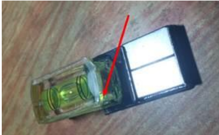
Hình 7. Mặt phía dưới hộp khóa nòng của súng

trình ngắm bắn ngoài việc giống đường ngắm cơ bản vào điểm định ngắm trên mục tiêu, quan sát bọt nước trên thiết bị, điều chỉnh bọt nước cho thẳng bằng vào chính giữa 2 vạch khắc khi đó nếu thực hiện phát bắn bảo đảm sẽ trúng mục tiêu đạn sẽ không bị tản mát, lệch trái hoặc lệch phải.