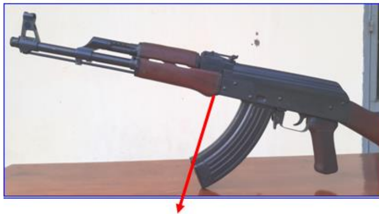
Hình 6. Mặt phía dưới hộp khóa nòng của súng

- Chế tạo thiết bị: Tác giả sử dụng phương pháp gia công cơ khí, hàn, tiện để lắp ghép các bộ phận nêu trên thành thiết bị hoàn chỉnh.